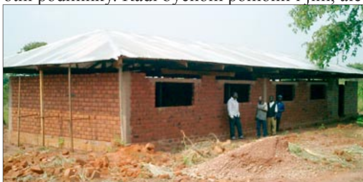
P: ...skoro hotovo!