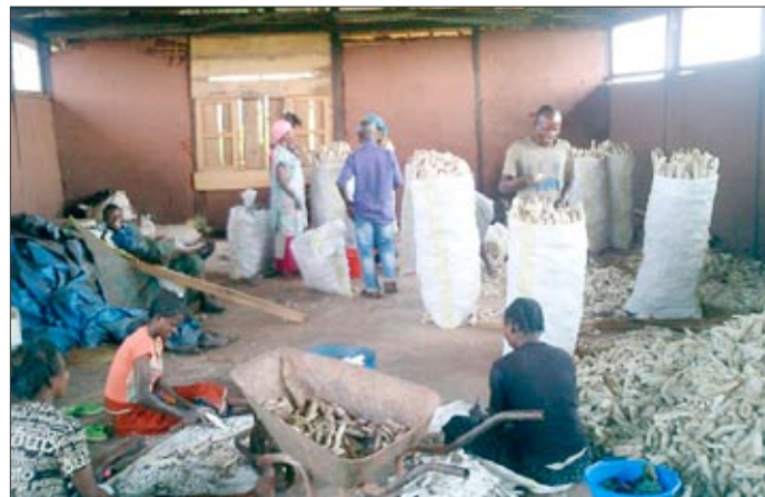
Výroba stojanů na sušení manioku po 3 denním namáčení