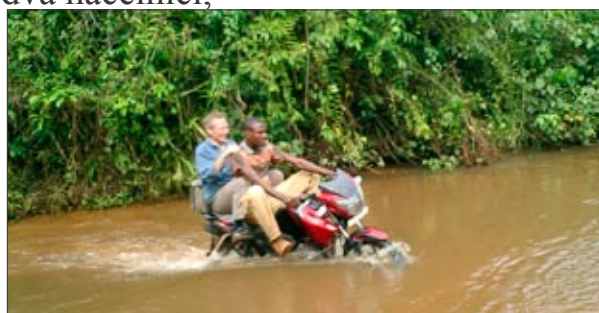
...a na motorce přes řeku - cestování v buši