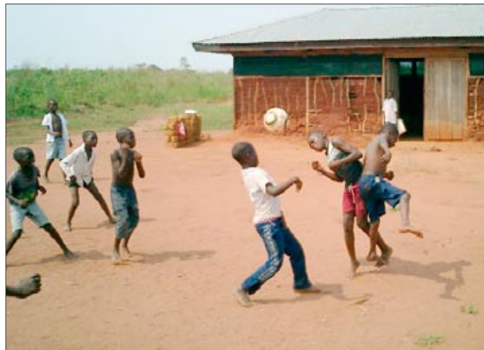
Děti se moc baví při hře s opravdovým fotbalovým míčem!