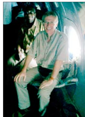
Uvnitř nákladního letadla