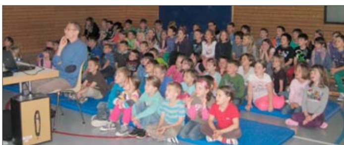
Prezentace ve škole v Gerbachu, která také sponzoruje

velký příliv žáků, kteří chtějí chodit do naší školy, byl poněkud nečekaný. Nemělo to být takovým překvapením, uvážíme-li, že naše škola má mnohem prostornější třídy než školy v ostatních vesnicích. Žáci se učí francouzsky od první třídy a škola je zdarma, což je v Kongu něco neobvyklého. Toto všechno je možné jen díky našim