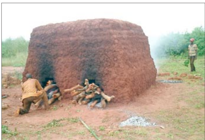
Nová pec na výrobu pálených cihel

musíme se nejdříve zajistit pořádné školní budovy v Mushapu a stabilizovat tento projekt.