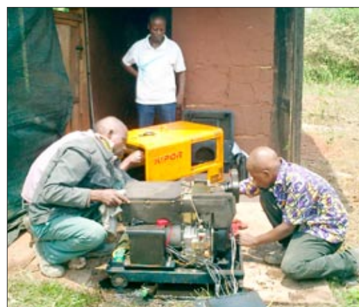
Tým z Denysu-výměna oleje v generátoru