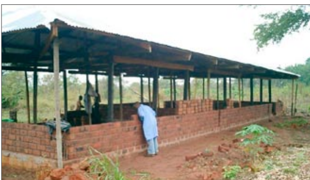
L: Nejdříve střecha na ochranu před deštěm, pak zdi ...

Wolfgang také podnikl krátkou průzkumnou cestu do jiné vzdálené části Konga, na západ do regionu Maduda. Je to další zapomenutá venkovská oblast, ve které se lidé snaží zlepšit své životní podmínky. Rádi bychom pomohli i jim, ale