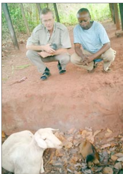
Naše první jehňátka