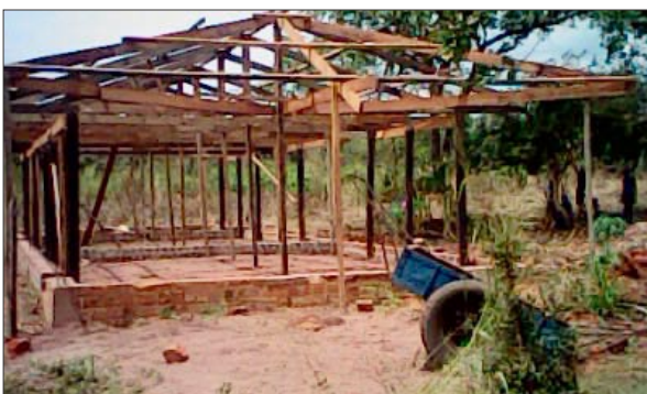
Výstavba střechy pro naši 2. školní budovu

Druhá zděná budova je téměř dokončena, ale potřebujeme 4 další budovy a snažíme se na ně získat potřebné finance. Také bychom rádi investovali více do zemědělského projektu, aby tak vznikl lepší zdroj financí do budoucna. Jedním z pozitivních vedlejších účinků nárůstu všech těchto aktivit je, že vzniká více pracovních míst pro místní populaci: