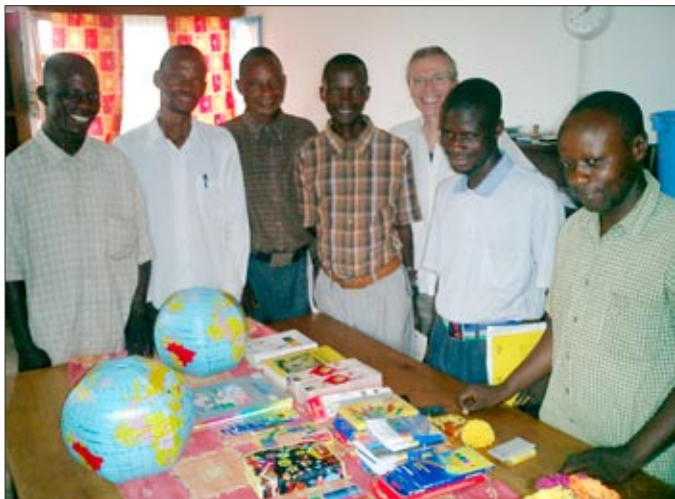
Sešity a pera od školky v Miesbachu