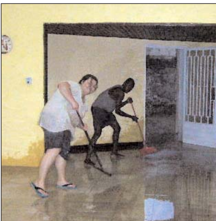
Regen überschwemmt unser Haus

Auf der anderen Seite machten wir große Fortschritte. Als wir in unser neues Heim einzogen, sagte einer unserer engen Freunde hier: "Jetzt habt ihr einen Sitz im Kongo". Unser lieber Hausbesitzer hilft uns weiter beim Einrichten, und wir sind sehr dankbar für alle, die