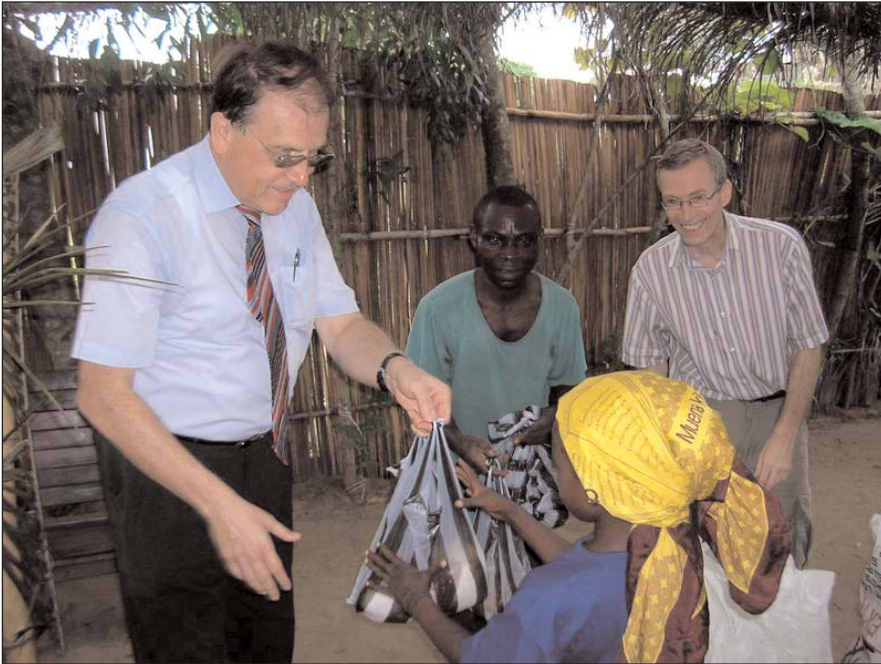
Der Botschafter von Deutschland hilft beim Essenverteilen in Kikimi/Mokali