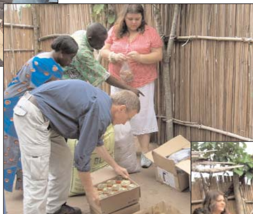
... bis wir dort kochen können.

Um den Kindern in Mokali mehr helfen zu können, suchen wir Sponsoren für ein kleines Gebäude auf dem oberen flachen Teil des Grundstücks dort. Ein Raum ist für eine kleine Familie geplant: der Mann soll das Feld bestellen und bewachen, damit wir mehr investieren können, wie z.B. Fische für die Fischzucht; die Frau soll für die Kinder kochen. Dazu kommen zwei größere Räume, wo die Kinder essen und später lernen können, wenn wir soweit damit sind. Die Lebensmittel und Werkzeuge