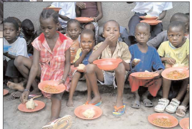
... & die Kisenso-Kinder bekommen täglich ihr Mahl

Um den Kindern in Mokali mehr helfen zu können, suchen wir Sponsoren für ein kleines Gebäude auf dem oberen flachen Teil des Grundstücks dort. Ein Raum ist für eine kleine Familie geplant: der Mann soll das Feld bestellen und bewachen, damit wir mehr investieren können, wie z.B. Fische für die Fischzucht; die Frau soll für die Kinder kochen. Dazu kommen zwei größere Räume, wo die Kinder essen und später lernen können, wenn wir soweit damit sind. Die Lebensmittel und Werkzeuge