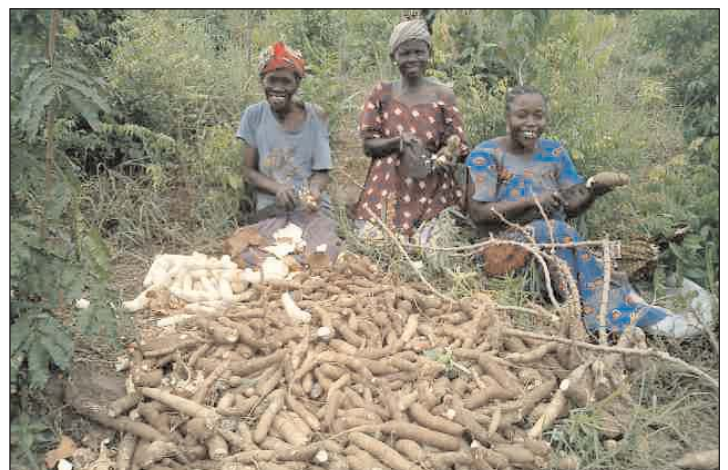
Das Endprodukt: frisch geerntete Kassawa Kartoffeln