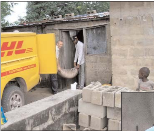
Verschiedene Leute helfen uns Lebensmittel zu den beiden Waisen-Zentren zu bringen