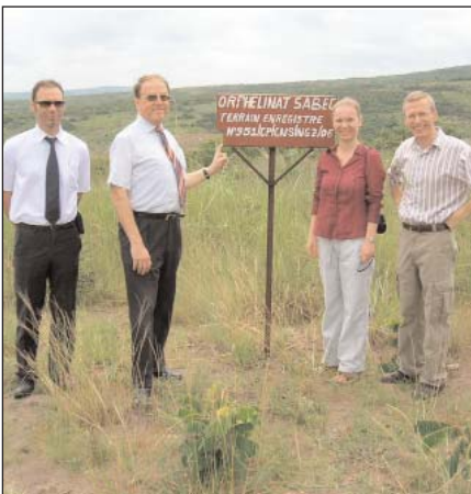
Hier soll das Gebäude entstehen

vorstellen. Als wir erklärten, dass unser Beitrag so klein sei im Vergleich zu dem, was anderen großen internationalen Hilfs-Organisationen zur Verfügung steht, ermutigte er uns und sagte, dass manchmal kleine Projekt mehr ausrichten können als große. Er ermutigte uns nicht nur mit Worten, sondern arrangierte auch eine spezielle Fahrt, um das Feld und die Kinder in Mokali zu besuchen, und will sehen, wie er uns helfen kann, die Baupläne auszuführen.