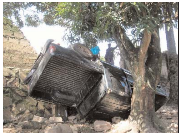
Keiner verletzt: Auto brach durch unsere Mauer