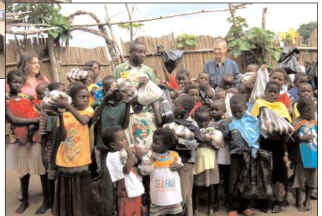
Die Kinder sind so dankbar für ihr Essen & T-shirt