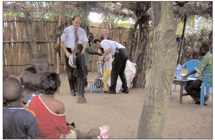
Deutscher Botschafter mit Begleitschutz kommen zu Besuch nach Mokali und hatten Spaß bei der Nahrungsverteilung