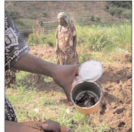
Die Oma kocht diese Grillen-larven

Einige von Euch haben uns gefragt, wie es mit der Mindestversorgung der Kinder steht. Die 10 Euro pro Kind pro Monat reichen kaum für die Grundnahrungsmittel aus, und wir danken unseren Freunden hier, die helfen diese zu ergänzen. Es wäre gut, wenn wir mehr Finanzen bekommen