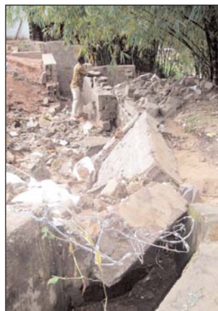
Die Mauer vom Nachbarn