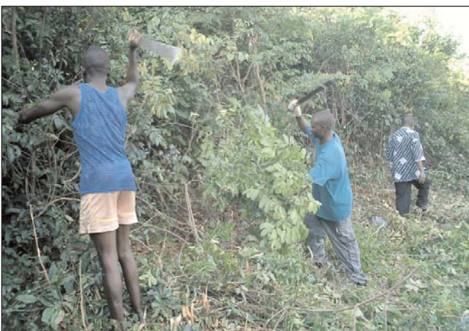
Ein neuer Teil vom Feld wird für den Anbau vorbereitet