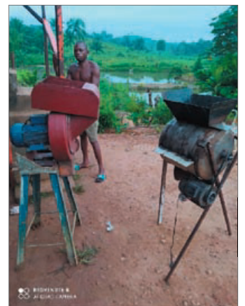
Machines à récolter.