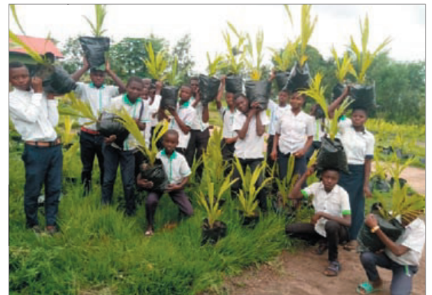
Les élèves apportent les palmiers à noix de notre école à la plantation située sur notre propriété.