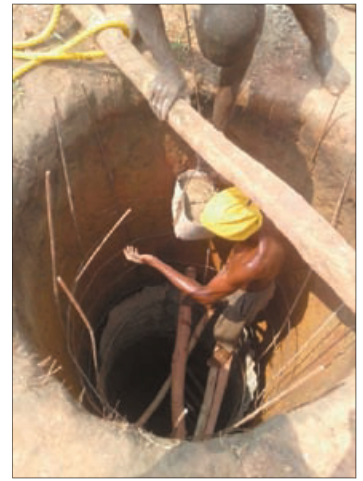
Le trou du puits est creusé. Préparer des anneaux en ciment. Filtre à eau. Mettre en place les murs en ciment dans le puits.