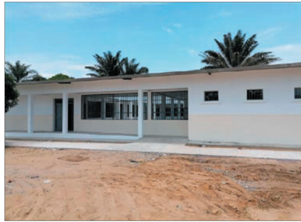
La nouvelle école et les dortoirs de Madlen, à côté du foyer pour enfants de Kimbondo, à l'extérieur de Kinshasa.

poissons ; il a également acheté des matériaux et construit deux machines, l'une qui facilite l'épéage du maïs et l'autre qui