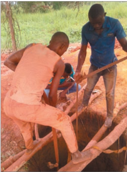
Travaux en cours sur le puits.