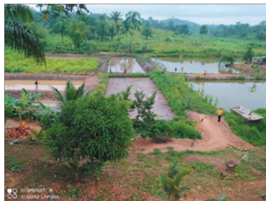
Champs de riz et de maïs. Étangs de pêche.