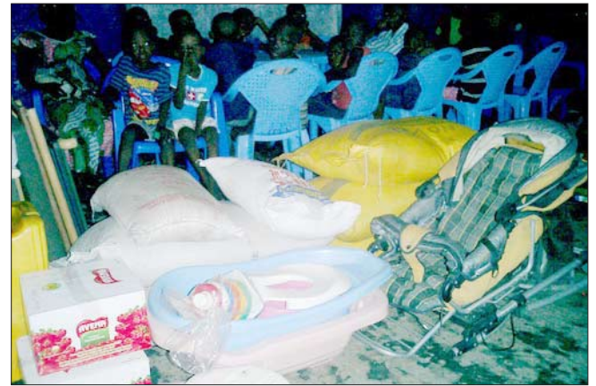
Distribution de matériel gratuit pour les écoles et orphelinats à Kinshasa et autres objets utiles pour les orphelins.

aux alentours de notre projet. La fondation Vodacom va nous fournir des bancs et pupitres. D'autres personnes nous soutiennent également financièrement et nous ont proposé de chercher davantage d'aide pour notre projet. Merci à tous pour votre soutien !