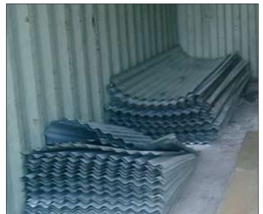
Poutres et poteaux en bois pour le toit, les portes et fenêtres. Fer pour les fondations. Tôle pour le toit.