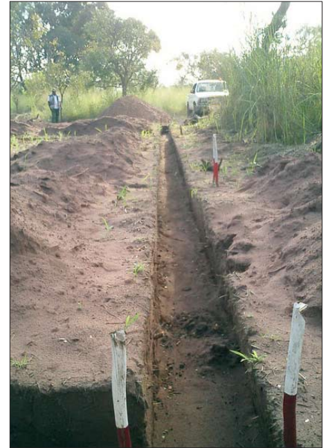
Base pour les fondations de l'école

Chantier: tente pour les gardiens, approvisionnement en eau, briques, sable et gravier