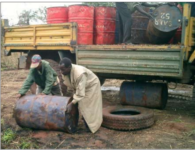
20 fois 200 litres d'eau pour le chantier

C'est pour nous à la fois un grand plaisir d'avoir débuté ce projet mais cela nous brise aussi le cœur de voir combien d'enfants n'ont jamais eu accès à l'éducation. Nous souhaiterions accueillir encore plus d'enfants mais pour cela nous aurions besoin davantage de soutien financier pour de nouveaux bâtiments et davantage de cours. Peut-être pouvez-vous également nous aider à trouver des personnes et organisations pouvant soutenir notre projet. Merci beaucoup !