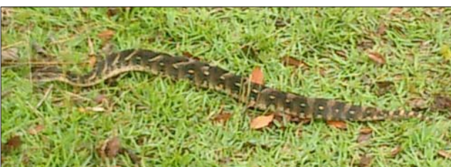
Cette vipère passant devant la cuisine a été le repas de personnes affamées. Une vraie délicatesse ici.