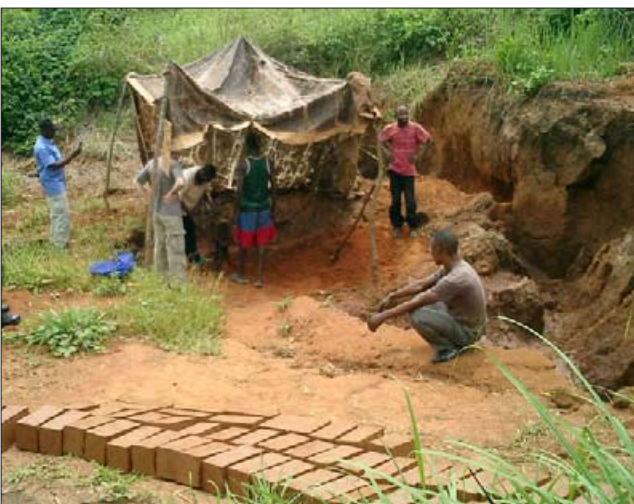
Davantage de briques sont pressées et séchées.